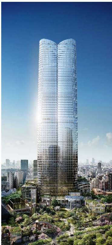
© DBox for Mori Building Co., Ltd.