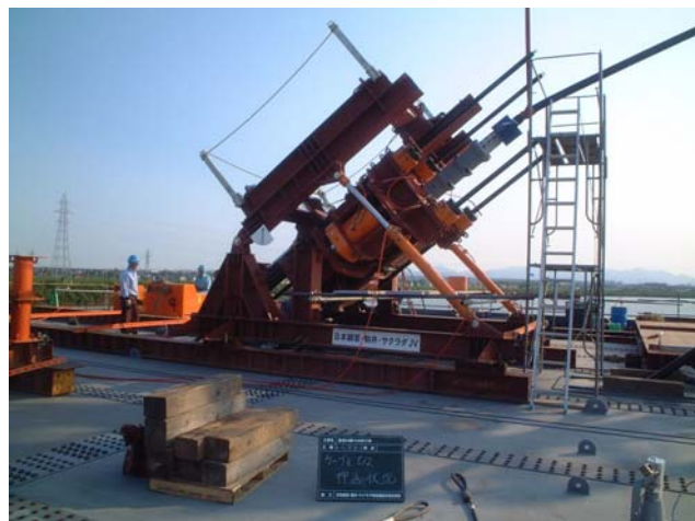
写真-1 ケーブル架設状況

塔側の定着は、桁上の 200t クローラークレーン（タワー使用）で所定の高さまで吊り上げ、塔内に