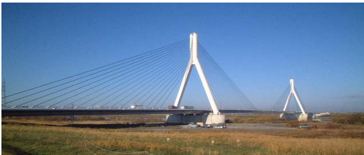
写真-2 平成 15 年 11 月 全景（石狩川左岸側より右岸側を望む）

本工事は、平成 16 年 2 月 16 日に無事竣工を迎えることができた。雄大な北の大地のシンボルとなる斜張橋建設に携わり多くのことを学ぶことができた。施工に関して北海道開発局札幌開発建設部清見工事課長を初めとし JV の多くの方にご意見ご指導いただきました。紙面を借りて感謝申し上げます。最後に完成時の写真を示します。（写真-2）