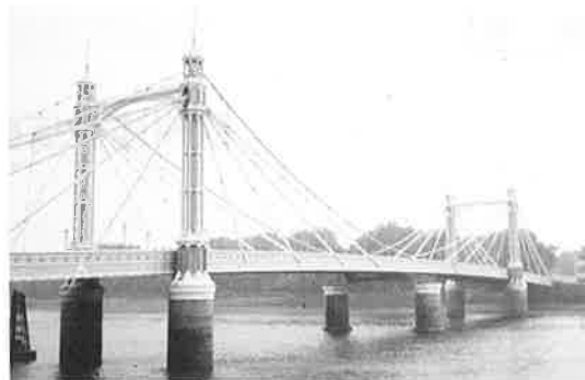
写真-2 アルバート橋

ハンバー橋はセバーン橋と同様、吊り材に斜めハンガーを使用していたが、セバーン橋のように、定着部の疲労による亀裂補修跡は見当たらなかった。理