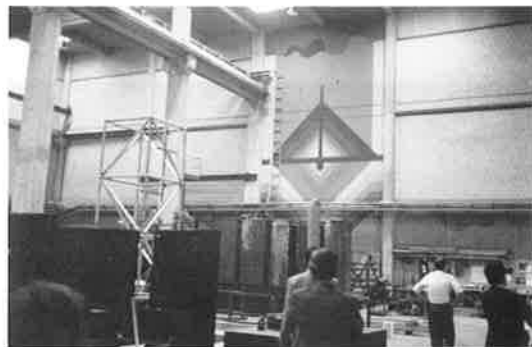
写真-5 ボーフム大学 実験室

またケーブルは、日本ではもうほとんど使用されていないロックドコイルを使っていた。理由は防錆力に優れており、クリープの問題も設計時に考慮しているのだから、一番良いとの事であったが、このあたりも日本における常識とはずいぶん異なっていると感じた。