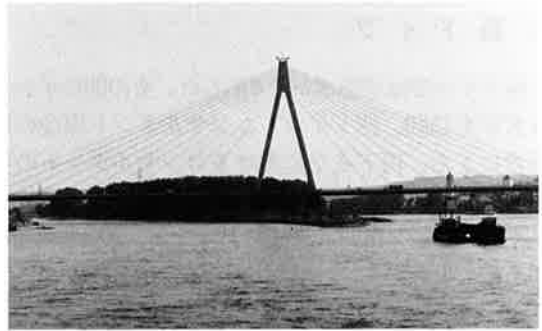
写真-8 ノイビート橋

また、西ドイツの橋梁の外観は、鋼製、コンクリート製にかかわらず非常にすっきりしていることに気が付いた。理由は、先に述べたように継手が全て溶