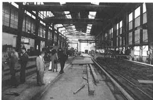
写真-15 Z. M. 社

スイスでは橋梁のトップメーカーである“Z. M. (Zwahlen & Mayr) 社”の工場見学を行った。工場は20m×100m程度の建屋1棟と部品工場、それに塗装工場だけで、比較的小規模であると感じられた。欧州では現場溶接が主流のため、仮組み立ての必要がなく、工場規模は小さくて良いのであろう。工場見学時、作業員は全てヘルメットを着用せず、我々もヘルメットなしで工場内へ入ったのは、どうも勝手が違うように思われた。