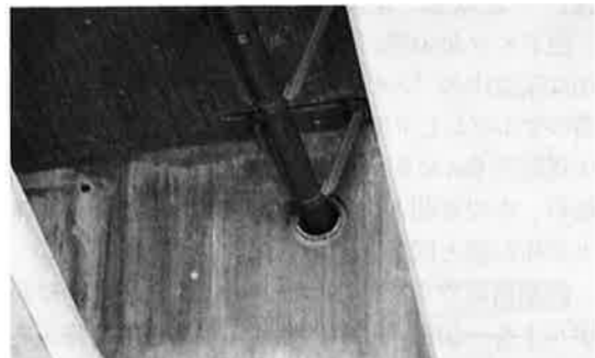
写真-12 排水管の配置