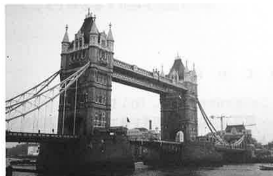
写真-3 タワーブリッジ