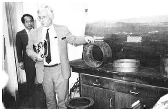
写真-1 ダウリング教授

特に、ケーブルの素線に鋼線ではなく、ガラス繊維を使用できないか、という実験には興味を覚えた。強度や定着部の構造は、十分実用化の段階に達しているが、火災やテロなどで、簡単に切断されてしまうという点が、まだ解決されていないとの事であった。