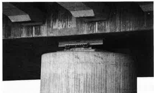
写真-11 支承のゲージ