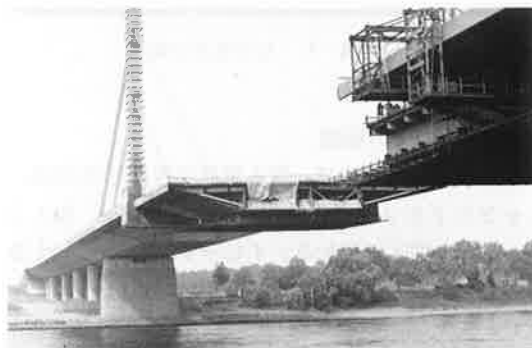
写真-6 A42橋 架設現場