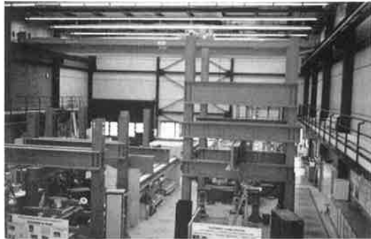
写真-13 ローザンヌ工科大学 実験室

また、現場には見学者の我々もヘルメットなしで、気軽に案内されたのであるが、安全に対する意識も、日本どの大きなギャップを感じた。