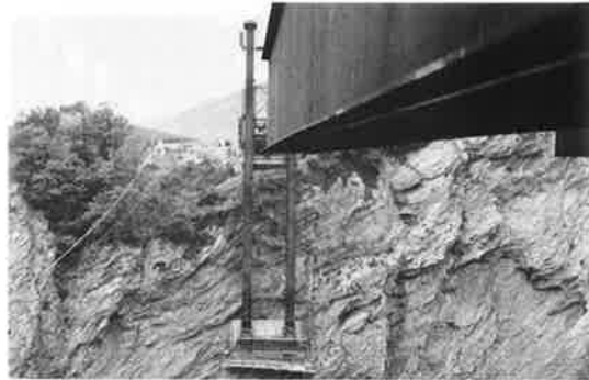
写真-14 グラ橋架設現場