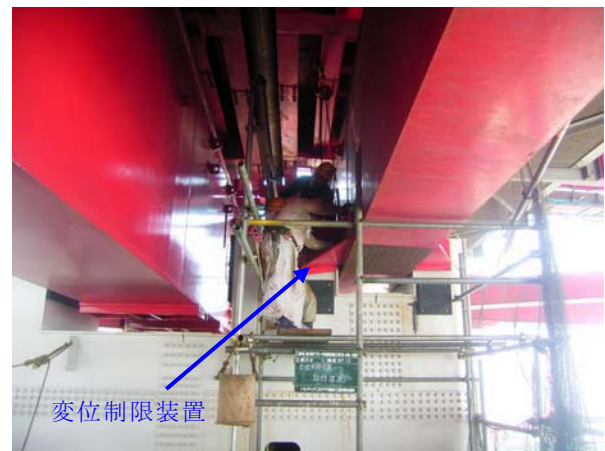
写真-7 変位制限装置設置状況