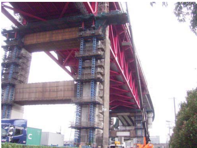
写真-10 ペント設備(荷受け台)