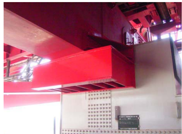
写真-8 変位制限装置設置完了