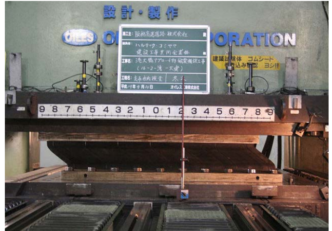
写真-11 支承性能検査

支承設置にあたり、事前に支承の製品検査を行い、規格内の製品であることを確認するとともに、性能検査においても想定される水平力に対して十分耐力があることを確認した(写真-11)。