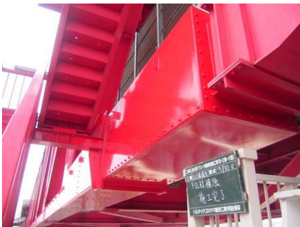
写真-5 トラス主構下弦材施工完了

今回の補強では，橋軸方向については，変位制限装置が設置されているので，橋軸直角方向についてのみとした．橋軸方向の移動制限装置の側面を利用する形で，トラス主構横桁に，箱型の新設部材（写真-8）を設置し，高力ボルトにて締付を行った．