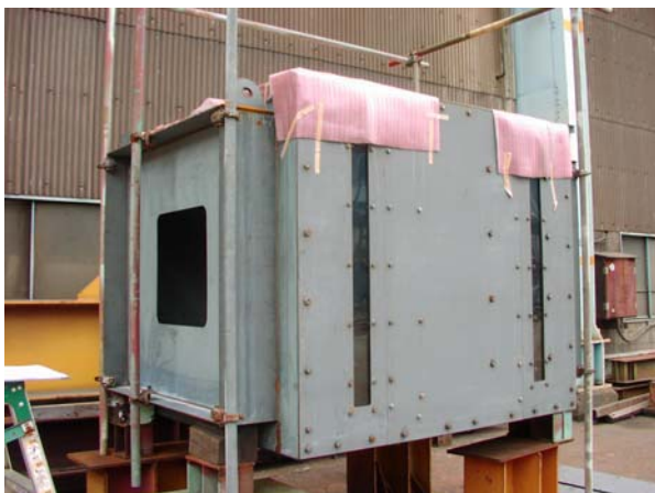
写真-6 下弦材実物大試験体