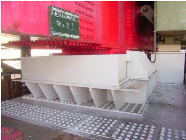
写真-9 トラス支承設置状況

この支承は、上架台、支承、下架台の 3 層構造となっており、地震時における水平荷重のみを受け持つ機能なので、横桁から支承に鉛直荷重が作用しないように、上架台と支承の間に隙間を設け、支承のせん断キーで水平方向の荷重を持たせる構造とした。隙間にはシール材を用いて耐水性と外観に考慮した。支承の水平移動量が許容移動量を超えると支承の破壊を起す為、下架台上の