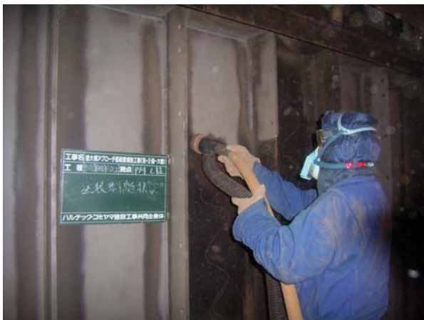
写真-2 塗装剥離状況