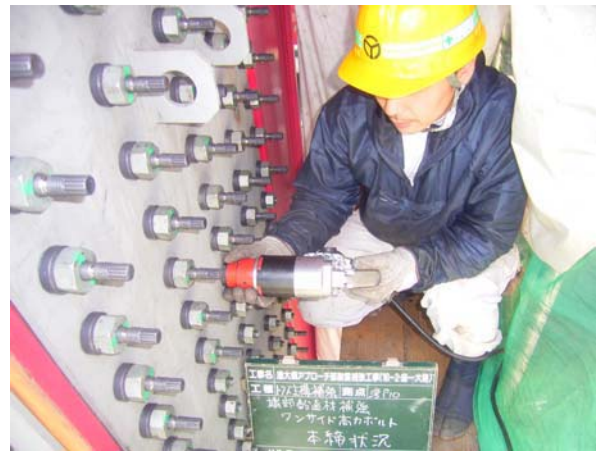
写真-3 高力ワンサイドボルト施工状況