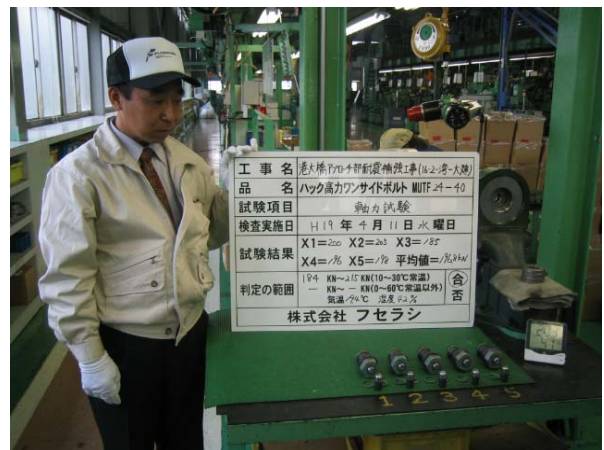
写真-4 高力ワンサイドボルト製品検査