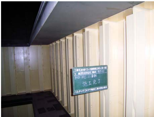
写真-1 補強部材取付完了

高力ワンサイドボルトは、片面施工ができるため、内側（反対）面からボルトを挿入する必要がないため、閉塞された場所には有用なボルトであった。しかし、高力ボルトに比べ締付けに要する時間が多くかかることが欠点であり、使用に際しては頻度、工程の検討が必要であることもわかった。