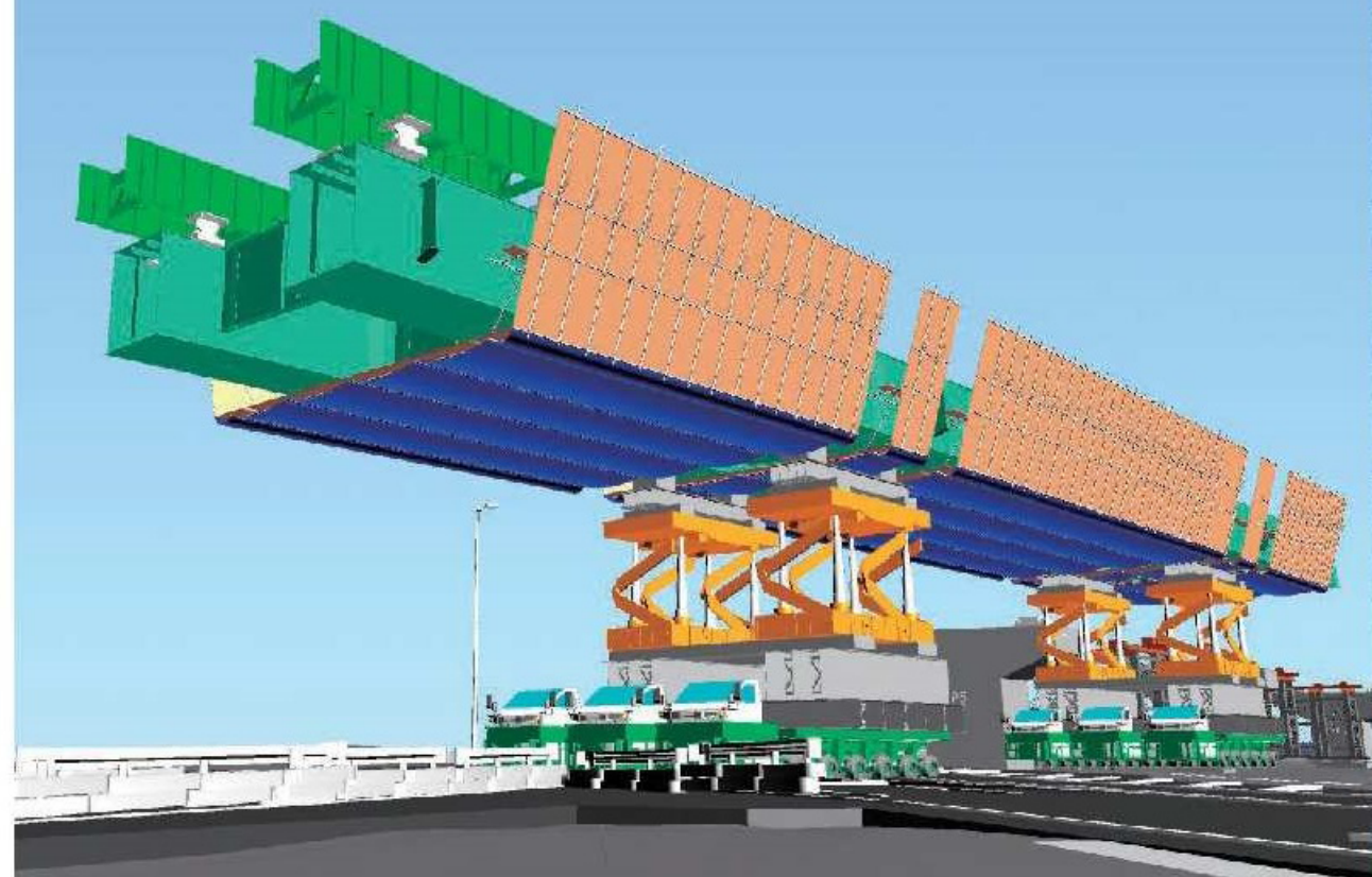
架設場所 (CGイメージ)